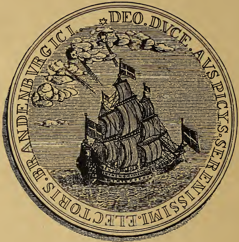
Titelfeite: Zeichnung von Hans Schirmer, Berlin / Oben: Medaille auf die afrikanische Expedition des Großen Kurfürsten